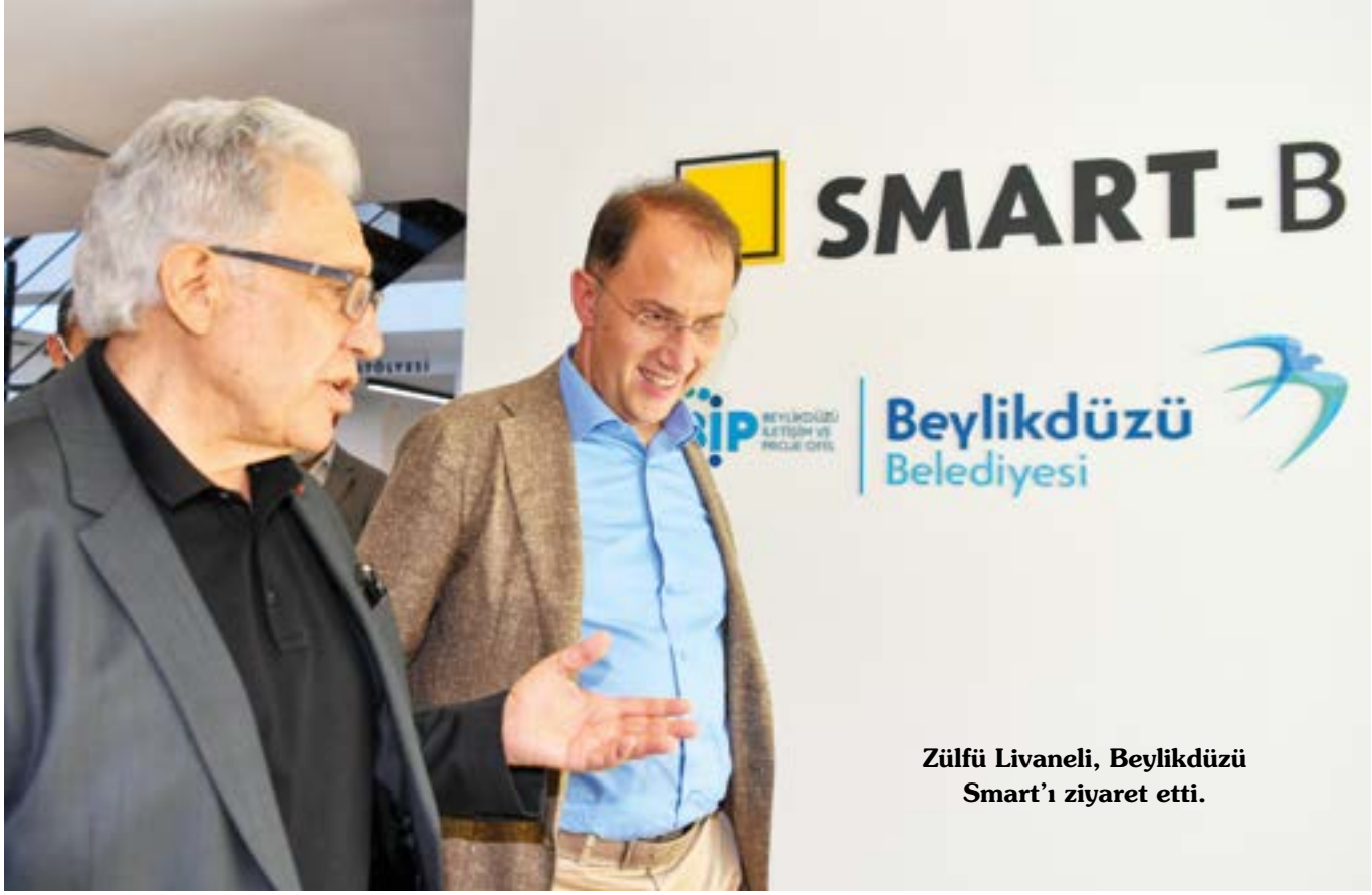
Zülfü Livaneli, Beylikdüzü Smart'ı ziyaret etti.

■ Üç yıl aradan sonra 'Balıkçı ve Oğlu' adlı romanınızla okuyucularınızla buluştunuz. Hikâyelerinizin her biri toplumu derinden etkileyen konular... Konu seçiminde sizin için belirleyici olan nedir?