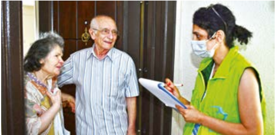
Saha Çözüm ekipleri Beylikdüzü'nün tüm mahallelerinde, her kapıyı çalıyor.